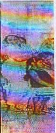
मंडी गोवि मौके पू

सल कौर) : फतेहगढ़ संघ की रखते हु नाशक विकरी