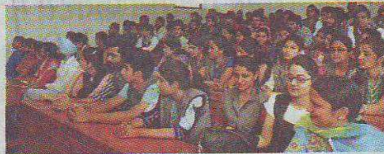
लायंस क्लब सुप्रीम के सेमिनार में मौजूद स्टूडेंट्स।