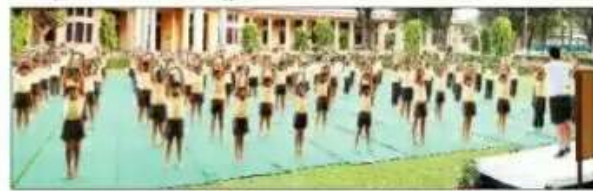
नाभा के पंजाब पब्लिक स्कूल के एन.सी.सी. कैडेट्स अंतर्राष्ट्रीय योग दिवस दौरान योग करते हुए। (चित्रण व फोटो : गोयल)

इस मौके पर 5वीं बटालियन पटियाला के अंतर्गत जी.पी.सी. कैडेट्स, एस.एन.ए.एस. स्कूल मंडी