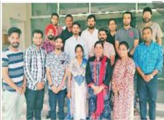
मंडी गोविंदगढ़ के जीपीसी में एल्युमनी सोशल वेलफेयर सोसायटी के नए चुने पदाधिकारी संबंधी जानकारी देते हुए संस्था पदाधिकारी