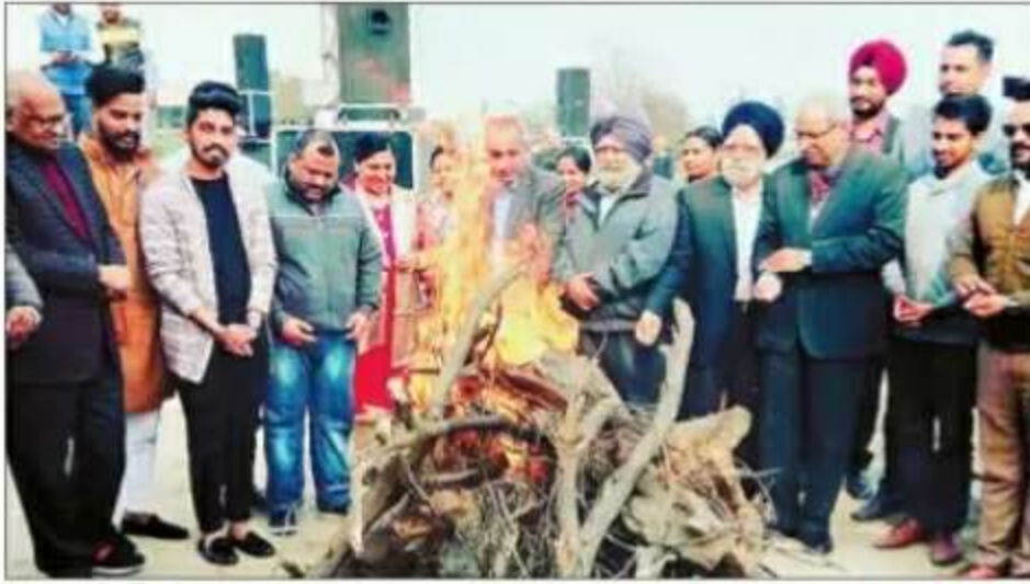
जी.पी.सी. एलुमनी की ओर से आयोजित लोहड़ी महोत्सव का दृश्य। (मग्गो)