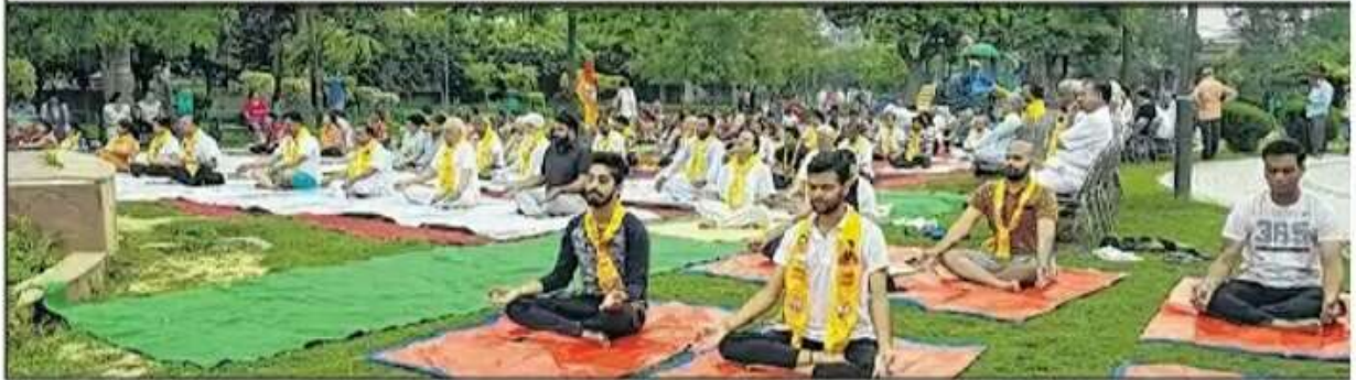
■ ਮੰਡੀ ਗੋਬਿੰਦਗੜ੍ਹ ਦੇ ਗਰੀਨ ਪਾਰਕ ਵਿਚ ਅੰਤਰਰਾਸ਼ਟਰੀ ਯੋਗਾ ਦਿਵਸ ਮੌਕੇ ਕੈਂਪ ਵਿਚ ਹਿੱਸਾ ਲੈਂਦੇ ਵਿਦਿਆਰਥੀ।